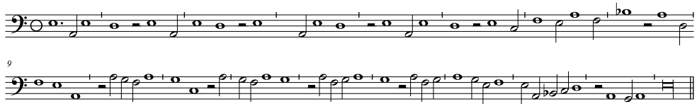
Beispiel 4: Josquin Desprez, Missa Malheur me bat , Kyrie II (Bassus)

Stimme integriert und bewusst als Spitzenton des gesamten Abschnitts exponiert. Wie weite Passagen der gesamten Messe wird das Kyrie II von Ostinato-Formeln beherrscht.